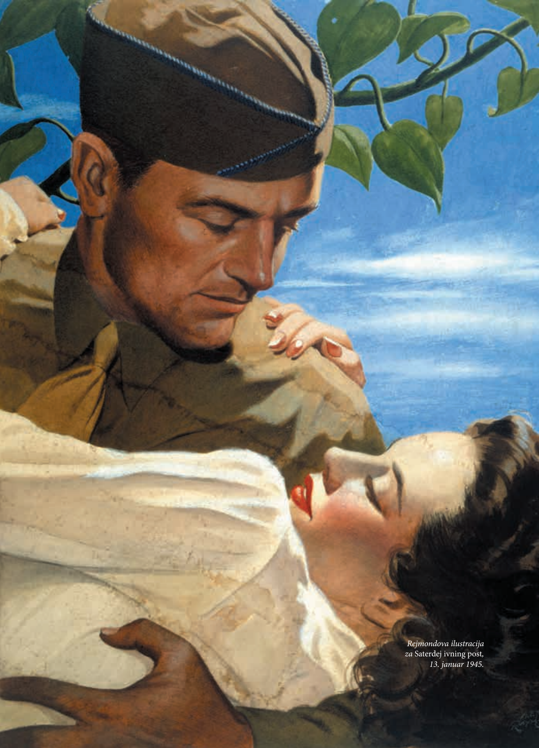
Rejmondova ilustracija za Saterdej ivning post, 13. januar 1945.