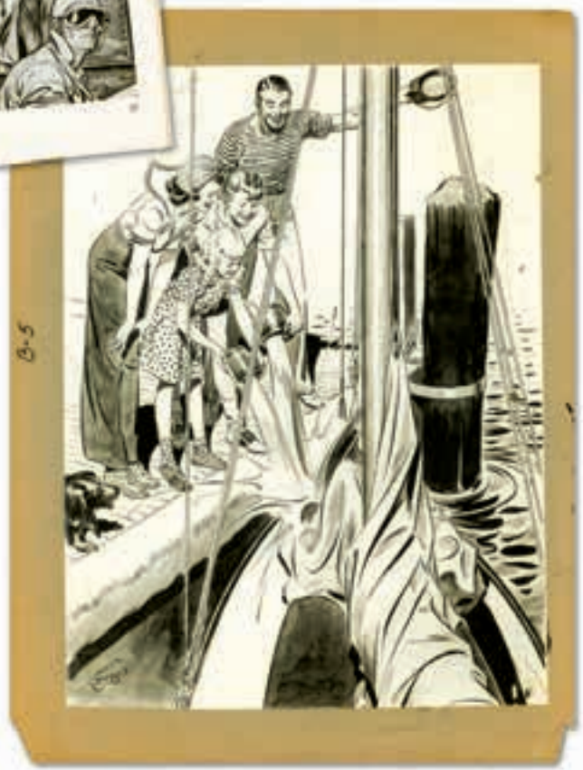
DOLE: Jedna u nizu ilustracija koje je Rejmond napravio za Atlantik mjučual inšurans kompani, objavljena u časopisu Jahting u avgustu 1941.

su bili bliže borbama. Prikazivale su tiho dostojanstvo, živu posvećenost i veselo drugarstvo vojnika koji su služili u ratu daleko od linije fronta.