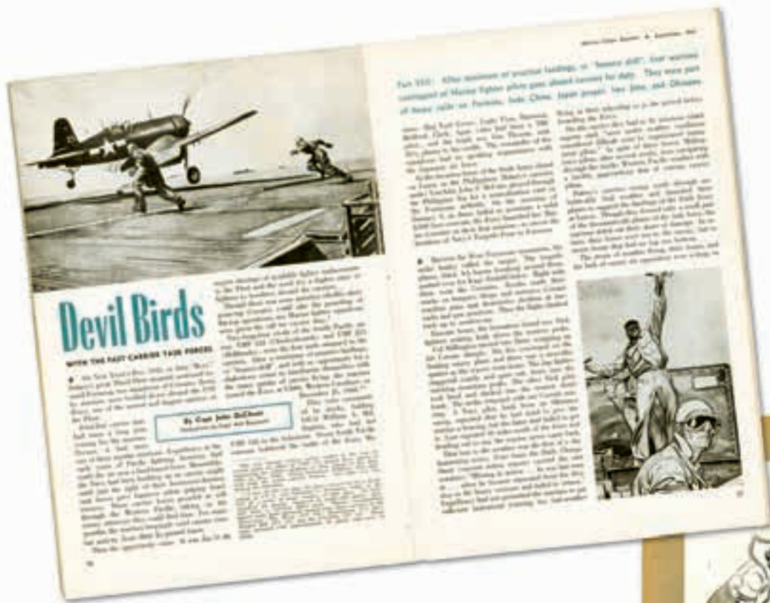
LEVO: Dve stranice iz Marin korps gazete, septembar 1947. Rejmond je ilustrirao prvi zapaženi članak o mornaričkoj avijaciji.