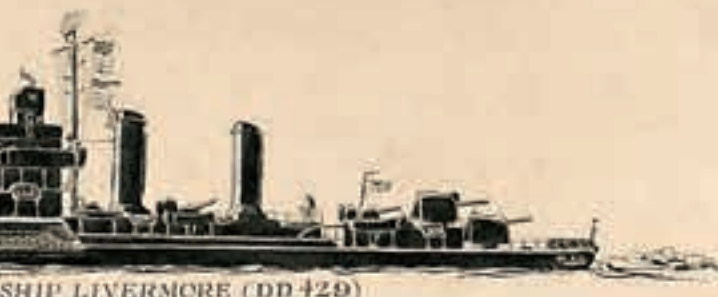
SHIP LIVERMORE (DD 429)