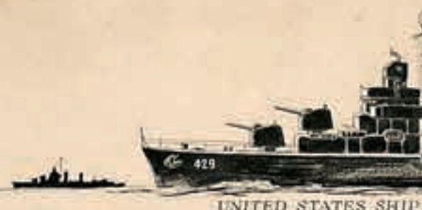
UNITED STATES SHIP