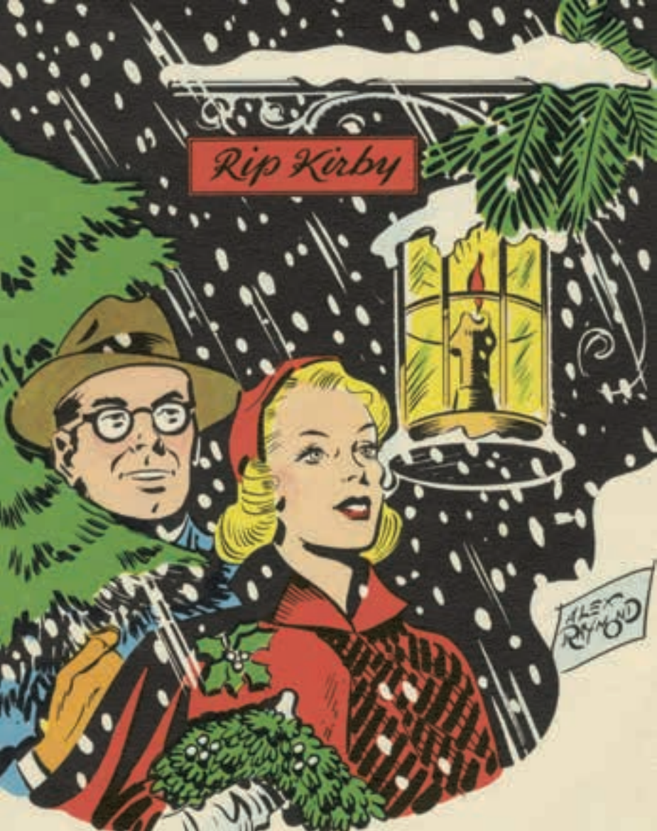
Božićna čestitka Ripa Kirbija™ koju je King fičers ponudio 1951. godine.

svojih stripova.” Berns je zakazao sastanak s Rejmondom u njegovoj kancelariji u centru Stamforda.